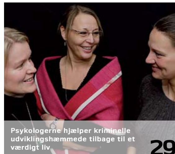
Psykologerne hjælper kriminelle udviklingshæmmede tilbage til et værdigt liv