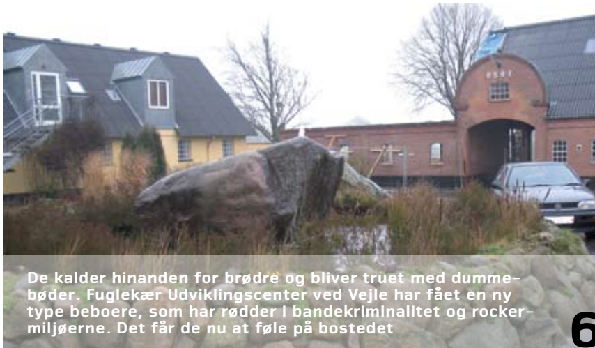
De kalder hinanden for brødre og bliver truet med dummebøder. Fuglekær Udviklingscenter ved Vejle har fået en ny type beboere, som har rødder i bandekriminalitet og rocker-miljøerne. Det får de nu at føle på bostedet