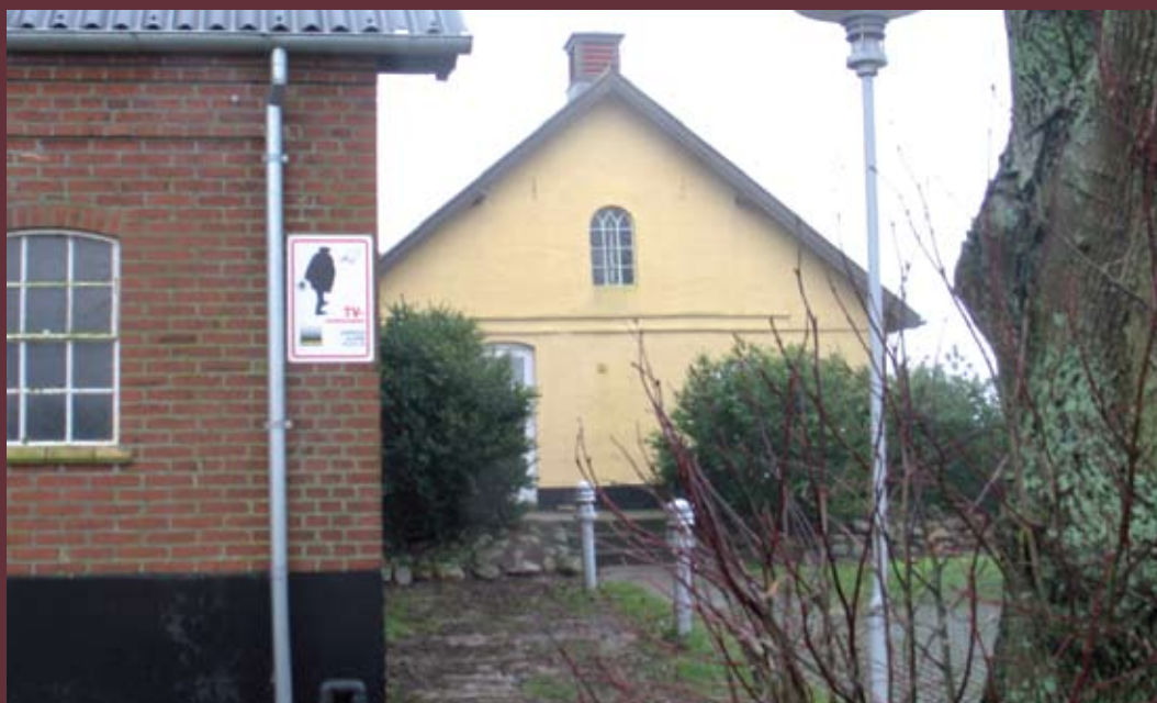
Overvågning er et nyt tiltag på Fuglekær Udviklingscenter, som er indrettet i en ældre firlænget gård i Børkop ved Vejle.

[Brødre] Uddeling af dummebøder, trusler og fund af oversavet jagtgevær er blevet virkelighed på bosteder for domsanbragte udviklingshæmmede. Flere af de bedre fungerende beboere bevæger sig på kanten af det rockermiljø, de gerne vil identificere sig med, men som udnytter dem.