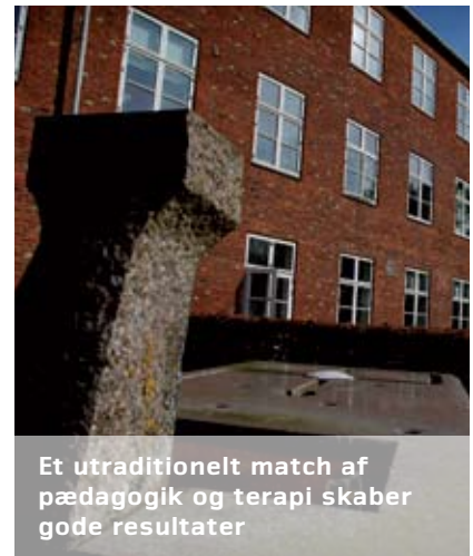
Et utraditionelt match af pædagogik og terapi skaber gode resultater